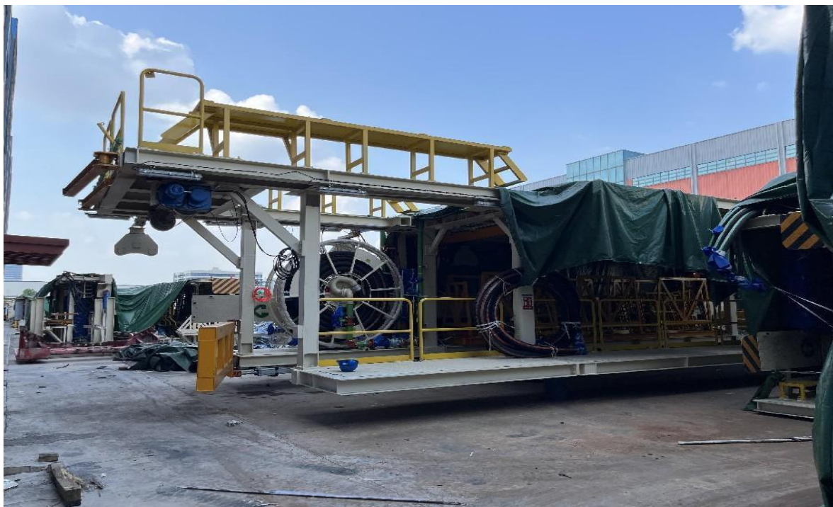
(图 1) DL1103 盾构机设备全貌